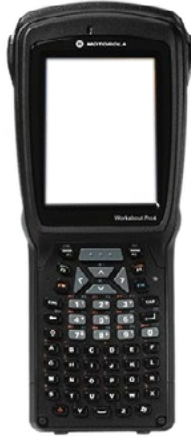
Zebra Workabout Pro 4 (ehem. Psion)