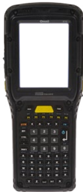
Zebra Omni XT15 (ehem. Psion)