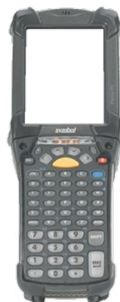
Zebra MC-9200 (ehem. Motorola)