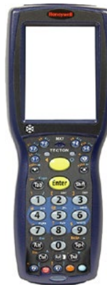
Honeywell Tecton CS