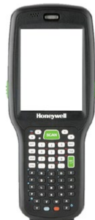
Honeywell Dolphin 6500