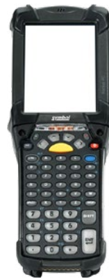
Zebra MC-9200 (Android Modell)